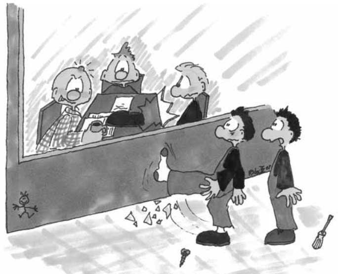
Zeichnung: Dany Schwientek

Eigentlich mochte ich Ihn von allen Vorgesetzten am meisten.