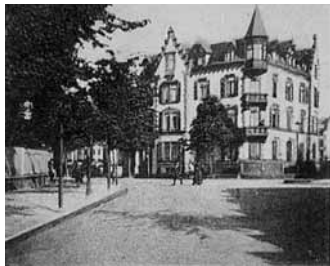
Blick auf die Ecke Nord/Eberhardstr., von der Strasse Im Schlosshof aus gesehen.

Auffällig das Gebäude an der Ecke Nord / Eberhardstr., das im Besitz der alleingesessenen Hanauer Familie Döhring ist.