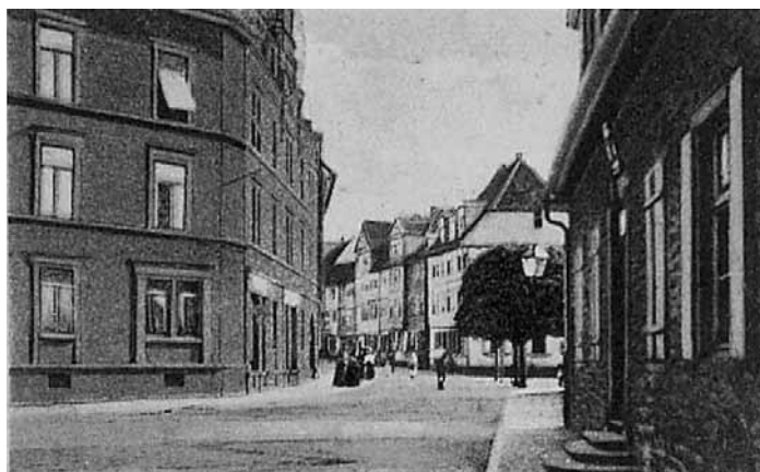
Blick in die Nordstrasse, rechts im Vordergrund das Gebäude der ehemaligen Finanzkammer

Die Bilder zeigen einen Blick von verschiedenen Seiten auf die Kreuzung der Straßen Im Schlosshof / Nord- und Eberhardstraße.