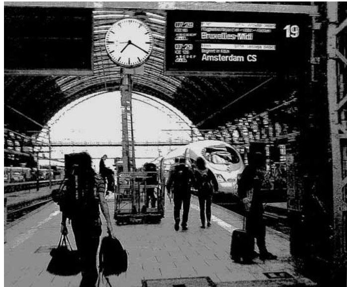
Mode, Musik, Kunst am 3.10.07 ab 11:00 Uhr CPH Südfoyer