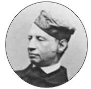
Moritz D. Oppenheim